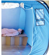
災害看護 ..... 災害看護に関する基礎的知識・技術を修得し、災害サイクル全般における看護職の役割について探究します。