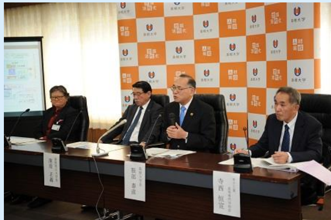
写真は左から平山松江工業高等専門学校長，清原島根県立大学長，服部学長，寺西米子工業高等専門学校長